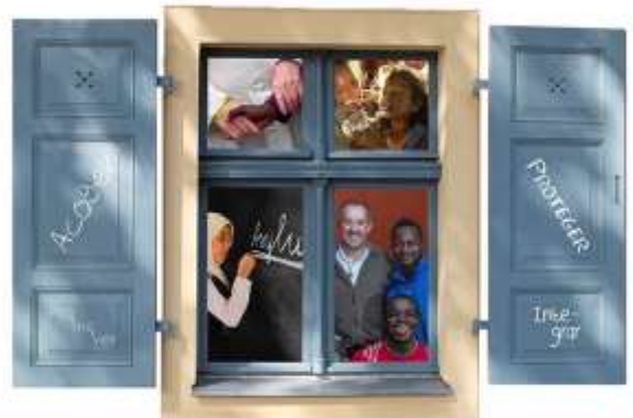
Acoger, proteger, promover e integrar a los emigrantes y refugiados

Todos los datos de que dispone la comunidad internacional indican que las migraciones globales seguirán marcando nuestro futuro . Algunos las consideran una amenaza. Os invito, al contrario, a contemplarlas con una mirada llena de confianza, como una oportunidad para construir un futuro de paz.